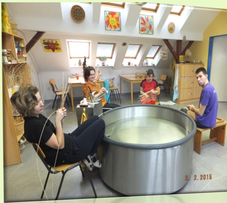
Obrázek 6 – Košíkáři