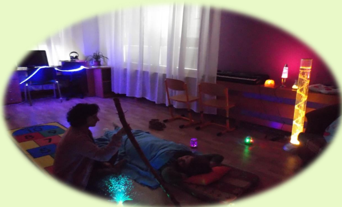
Obrázek 4 – Odborná práce našich pracovníků