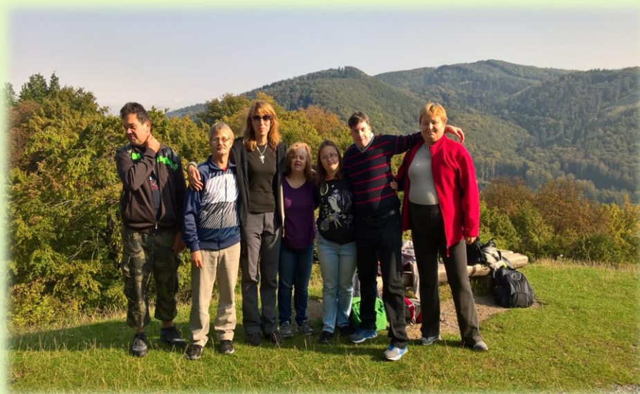
Obrázek 7- Výlet na Hukvaldy

Jedna ze zásad naší služby je podporovat uživatele v nezávislosti na službě. O to usilujeme tak, že naše uživatele podporujeme ve využívání dostupných veřejných služeb. Pokud je potřeba pomůžeme veřejné služby zprostředkovat, ale nenahrazujeme je.