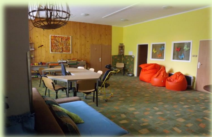
Obrázek 1 - Služba denního stacionáře