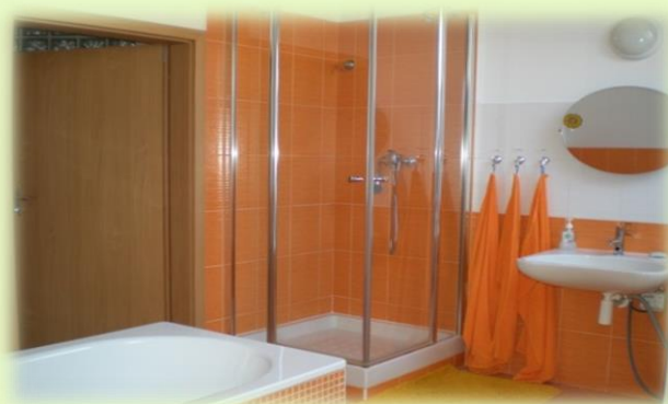
Obrázek 2 - Odlehčovací služba