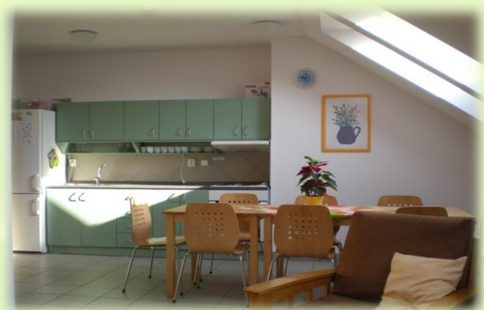
Obrázek 3 - Služba chráněného bydlení