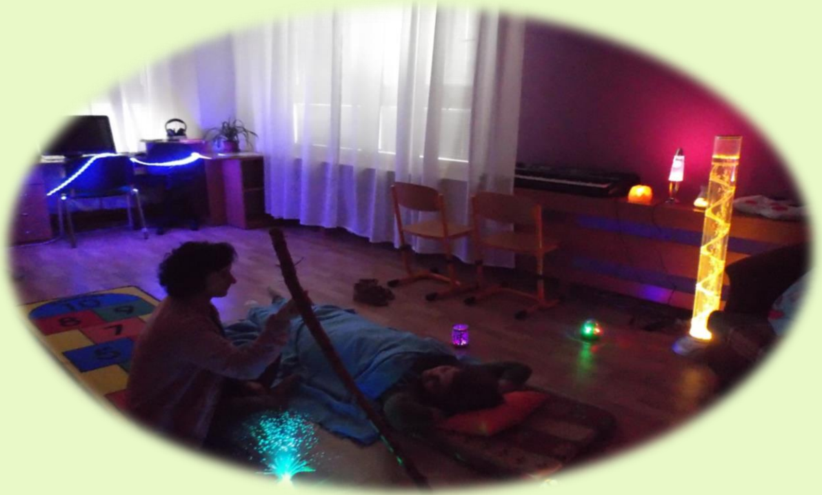
Obrázek 4 – Odborná práce našich pracovníků